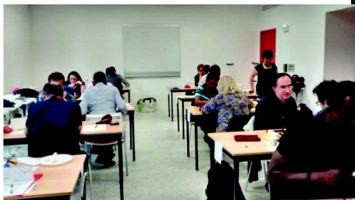
La Salle de Jeu